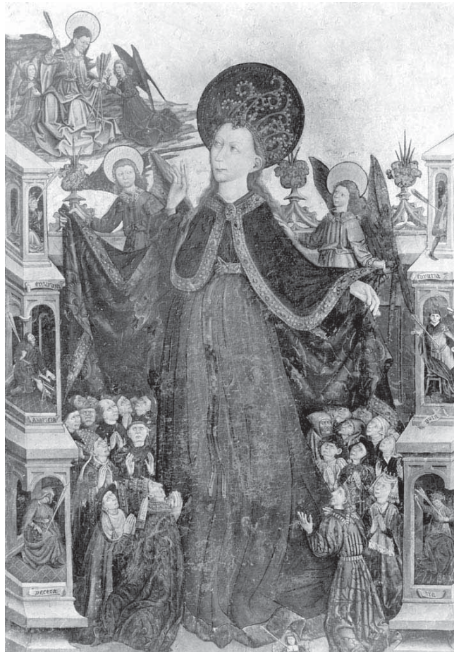
FIGURA 5. Mestre de Veïlla, Mare de Déu de la Misericòrdia . Palau Episcopal de Terol.