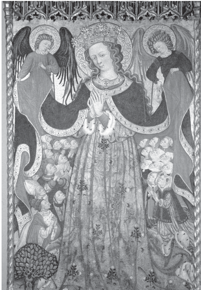
FIGURA 6. Atribuit a Bonanat Zaortiga, Mare de Déu de la Carrasca . MNAC, Barcelona.