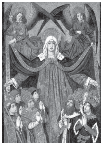
FIGURA 1. Bartolomé Bermejo i Martín Bernat, Mare de Déu de la Misericòrdia . Museu d'Art de Grand Rapids (Michigan).