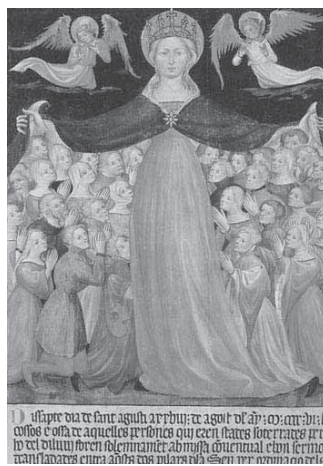
FIGURA 2. Mestre de Montí-Sion, Mare de Déu de la Misericòrdia . Museu Capítular de la Catedral de Palma.