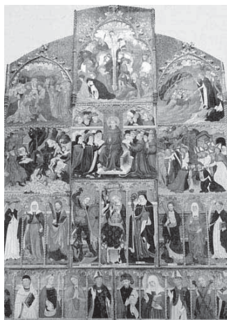
FIGURA 7. Lluís Borrassà, Retaula de santa Clara de Vic. Museu Episcopal de Vic.