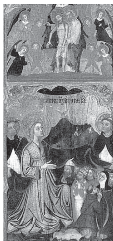
FIGURA 4. Francesc Comes, Mare de Déu de Gràcia . Museu de Mallorca, Palma.